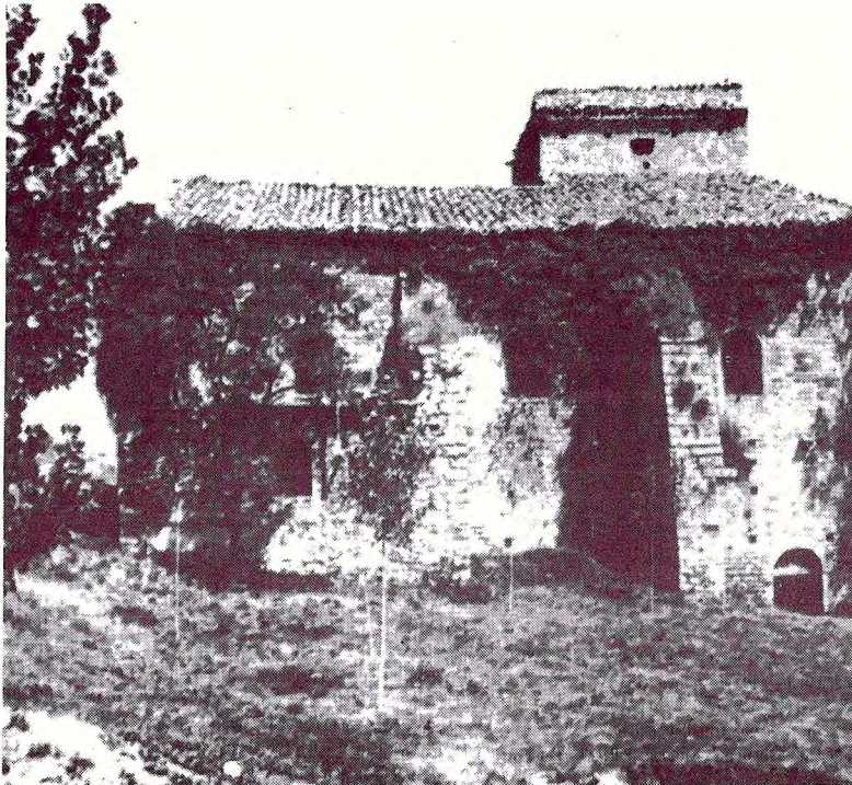
Vista exterior de l'església de Sant Llorenç prop Bagà des del costat de migjorn.